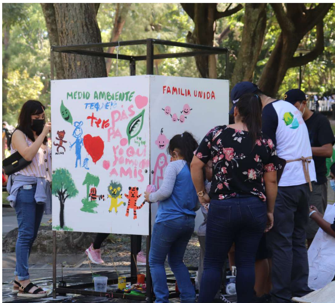
5TO FESTIVAL DEL CENTRO HISTÓRICO DE SAN SALVADOR, “VAMOS AL CENTRO HISTÓRICO”