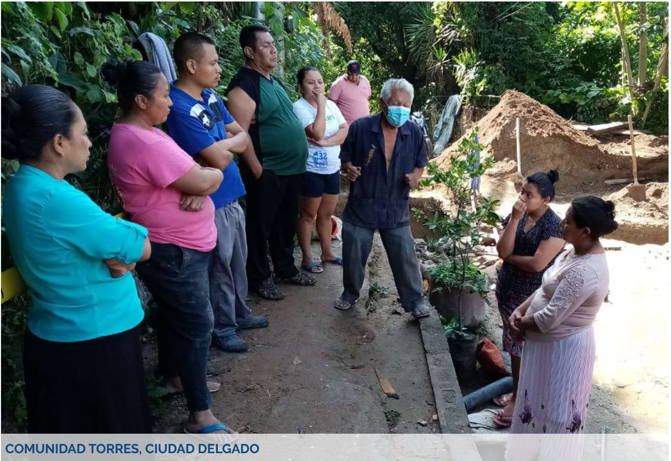
COMUNIDAD TORRES, CIUDAD DELGADO