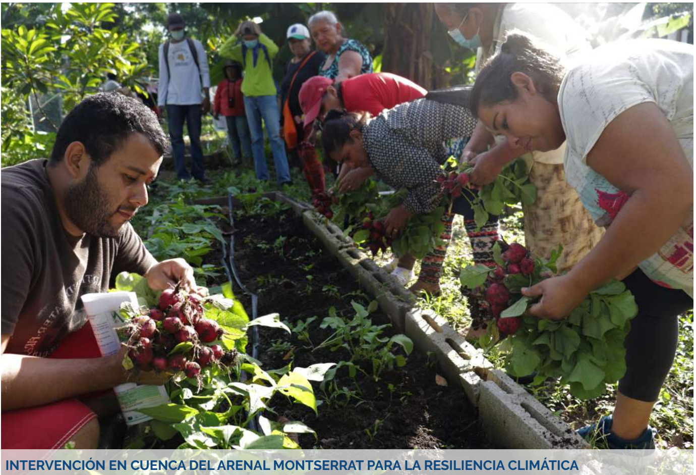
INTERVENCIÓN EN CUENCA DEL ARENAL MONTSERRAT PARA LA RESILIENCIA CLIMÁTICA