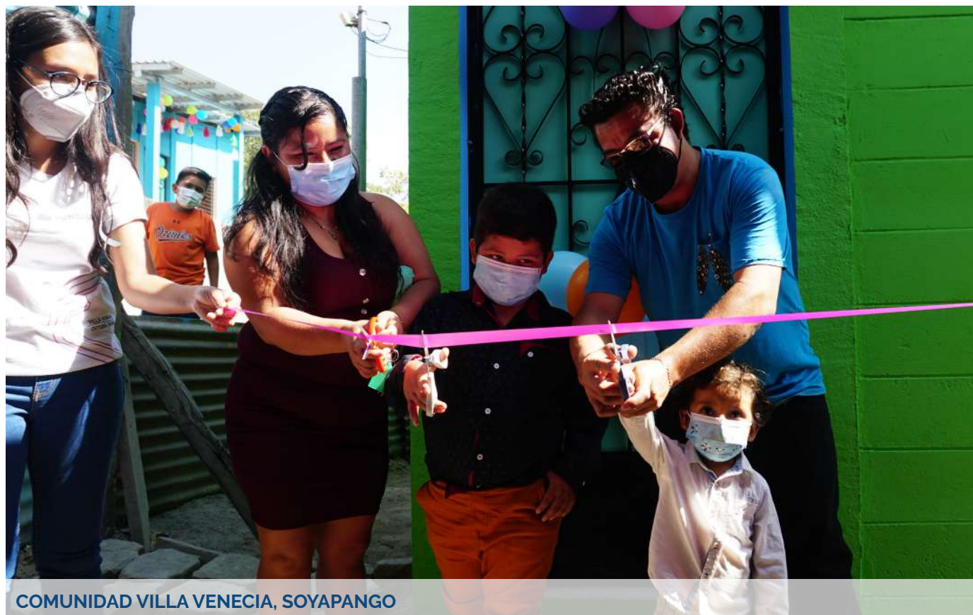
COMUNIDAD VILLA VENECIA, SOYAPANGO